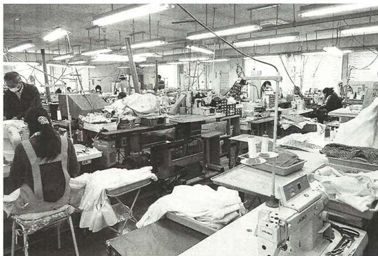
オーダーメイドのドレスシャツはベテラン職人の手作業が基本

り、カフスの幅を狭くしたりと型紙を修正するなど顧客のきめ細かい要望に応えられる。タイトなシルエットを好む若い客層が増えたことで今までのゆとり寸を変更することもある。